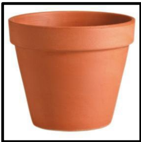
fig. 1 - pot de jardin « basique »

Les bandes adhésives sont enlevées après quelques heures afin de ne pas laisser de traces sur la surface de la poterie.